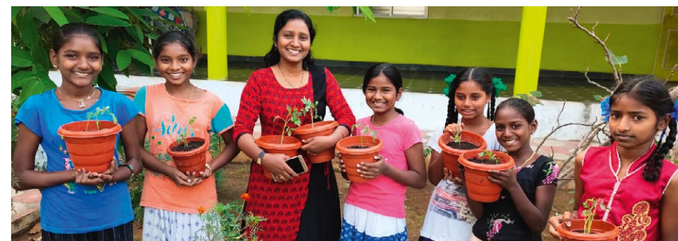
Nå spirer det og gror.