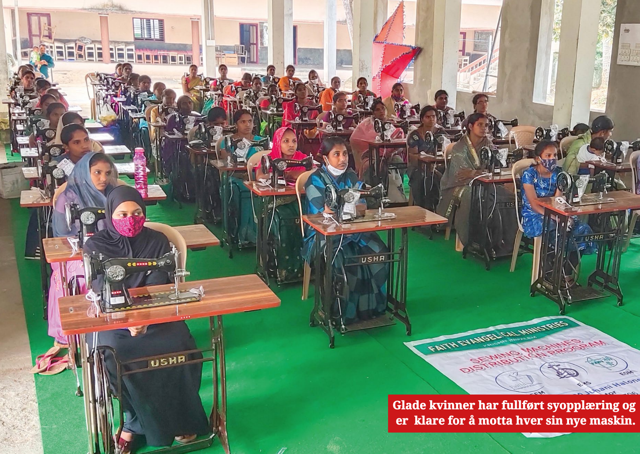
Glade kvinner har fullført syopplæring og er klare for å motta hver sin nye maskin.