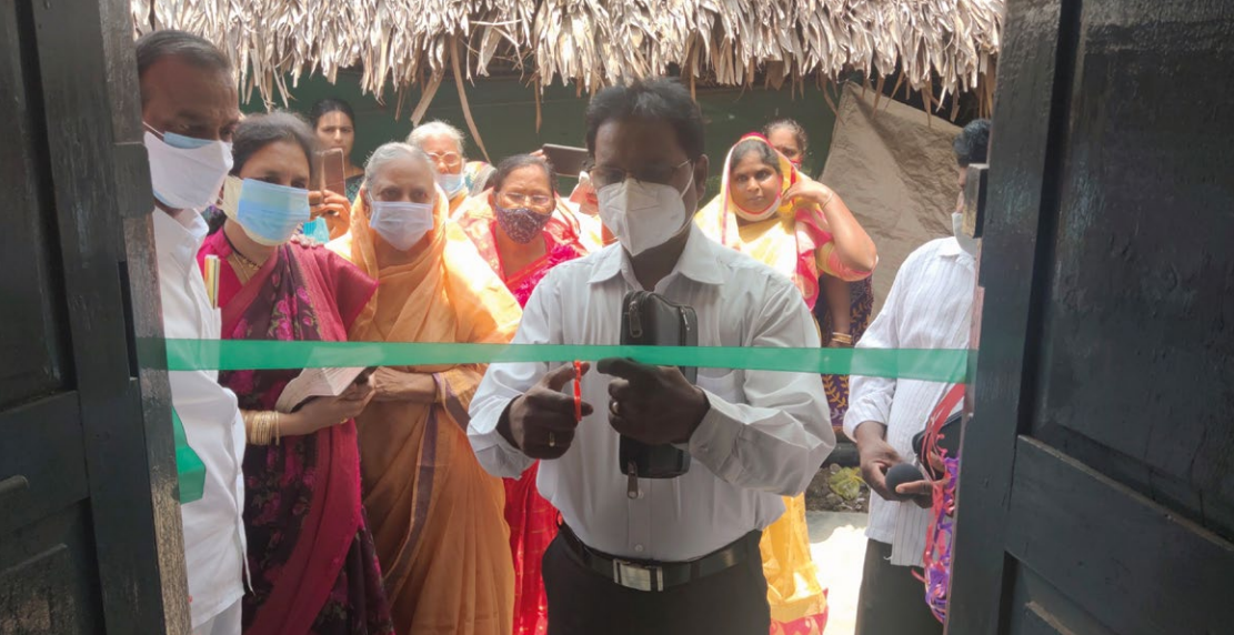
Juhani Halonen foretar den offisielle åpningen av kirken.