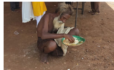
En av de mange som fikk en varmt måltid i forbindelse med Indias kristne dag

De prøver å skape et bilde av at kristendom er en britisk religion utbredt i India ved hjelp av penger fra Amerika, og at hinduisme er den eneste religionen som har vært i India