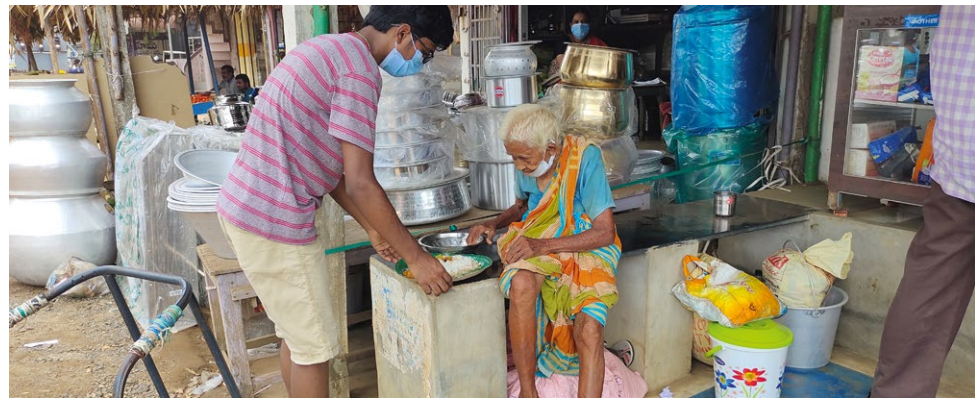
En glad mottager av varm mat.