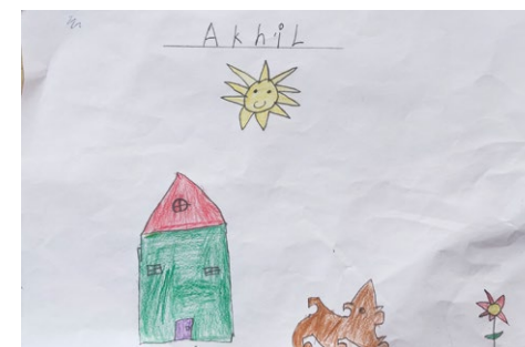
Tegning fra Akhil.

Oldemoren ble så berørt av dette at hun kontaktet oss, både for å fortelle historien, men også for å fortelle at hun ønsket å bli fast giver til vårt arbeid. Gud berører mennesker på de forunderligste måter. Vår samarbeidspartner Orientmisjonen har prosjekter i Nord-Korea.