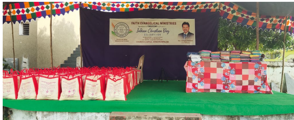
Her står klær og matposer klare for utdeling. Bak ser vi et banner som forkytter at dette er med hjelp fra Norge.