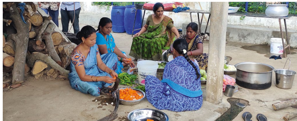
Medhjelpere forbereder det som skal bli en gratis, varm lunch til fattige i landsbyene.