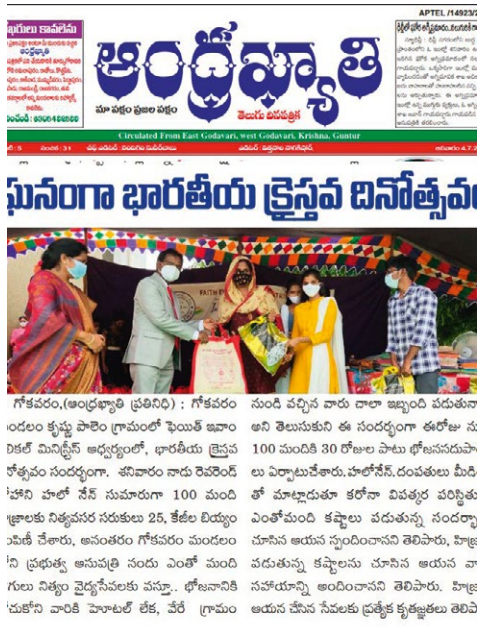
Markeringen ble bredt omtalt i pressen, både på TV og som her i avisene.