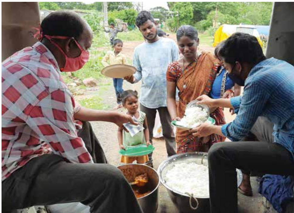
Medarbeidere fra Bethel Assembly deler ut varm mat til sultne landsbyboere.