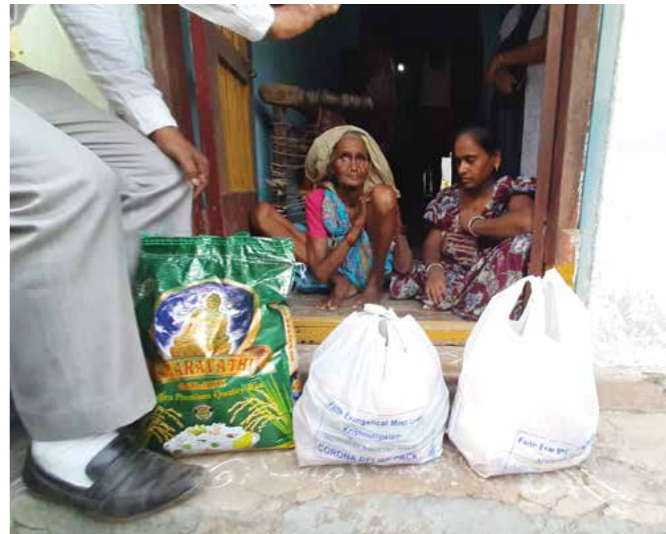
En sulten enke med en handikappet datter får mat av pastoren i den lokale EHH menigheten. De har senere begge blitt frelst og døpt.

På den måten har vi fått være med å distribuere mat til over