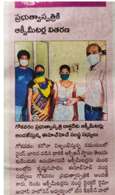
EHHs gave til sykehuset ble berømmet i den lokale avisen.

Og viktigst er det at mange får hjelp og at våre indiske venner virkelig tar på alvor Jesu ord om at «det dere har gjort mot en av mine minste, det har dere gjort imot meg».