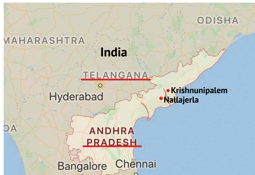
Kartutsnitt. Viser delstaten Andhra Pradesh og Telangana i India, samt hovedkontorene i Krishnunipalen og Nallajerla.