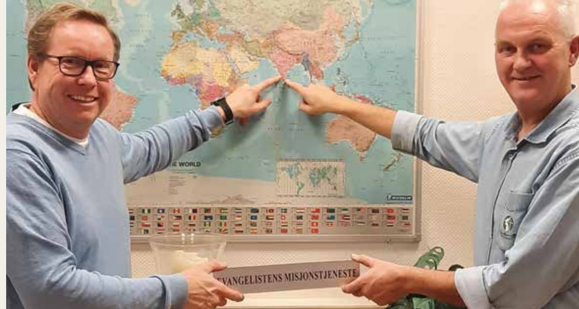
Her overrekkes «stafettpinne» videre.