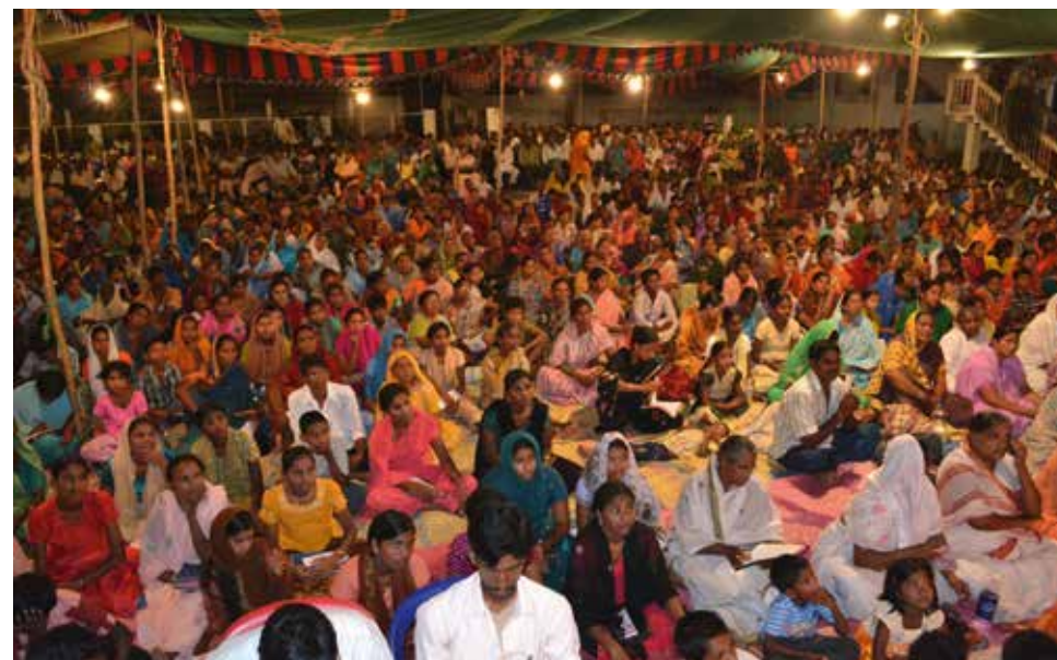
En stor folkemengde var møtt frem for å høre på gjesten fra Norge.