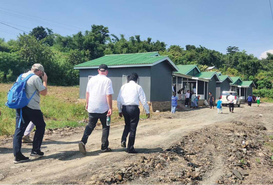
På vei for å se de nye boligene.