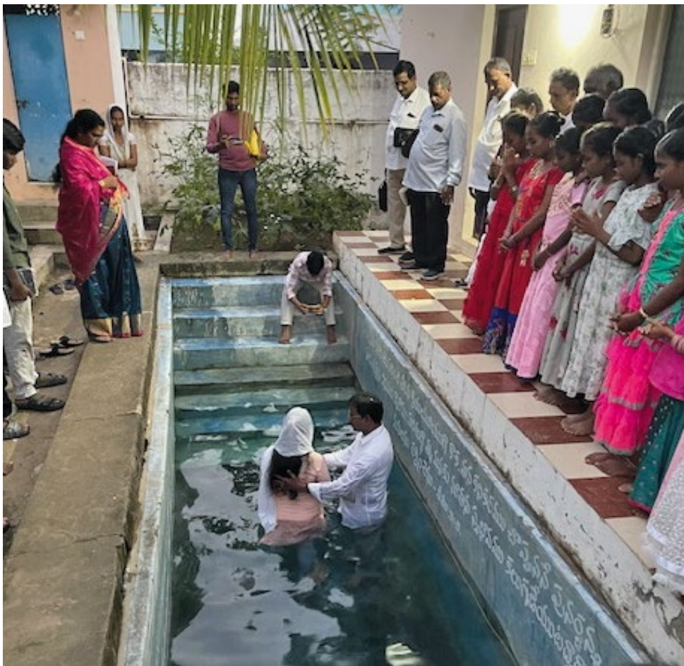
Dåp i Krishnuniapalem.

Noen av dere lesere som har fulgt med oss en stund, har kanskje lagt merke til at vi er mye mer forsiktige med å skrive om sider av menighetslivet hos våre venner i India. Dette skyldes at det har blitt strengere å drive kristen virksomhet mange steder, og dette med konvertering, altså å skifte religion, har blitt direkte forbudt.