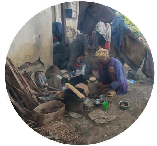
Fremdeles mange som mangler alt.