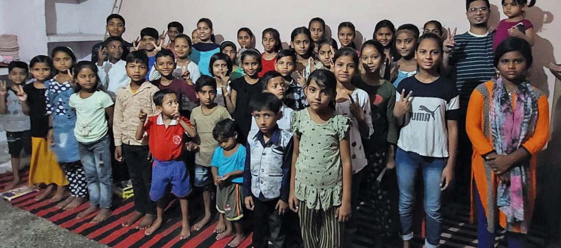
Søndagsskolen i Agra.