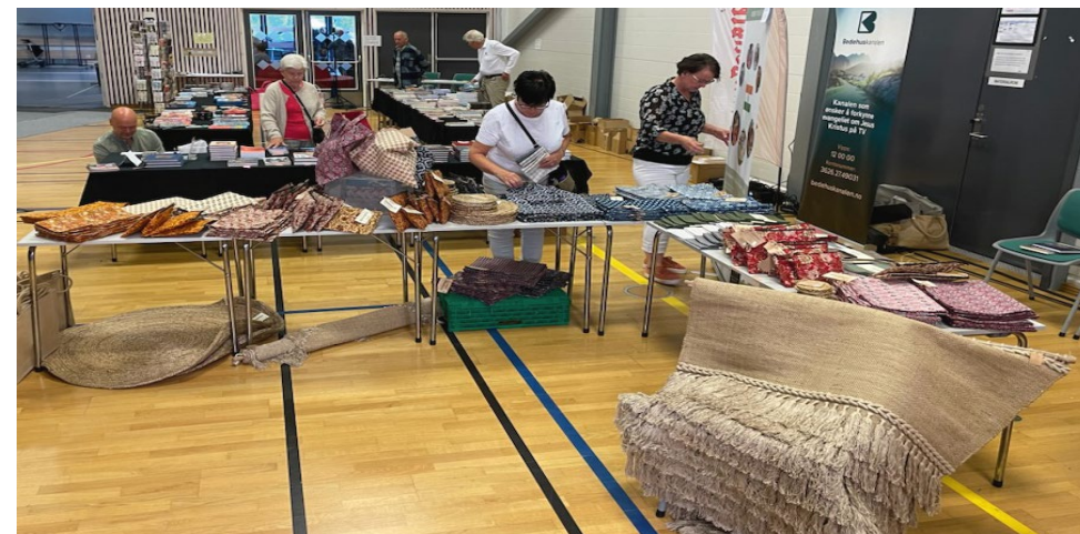
EOMs stand med salg av indiske produkter ble godt besøkt under stevnet.