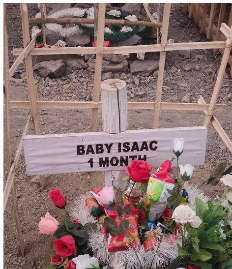
Noen av ofrene var nyfødte spedbarn.